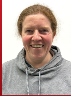
VAN ZWAM IN ROLSTOEL