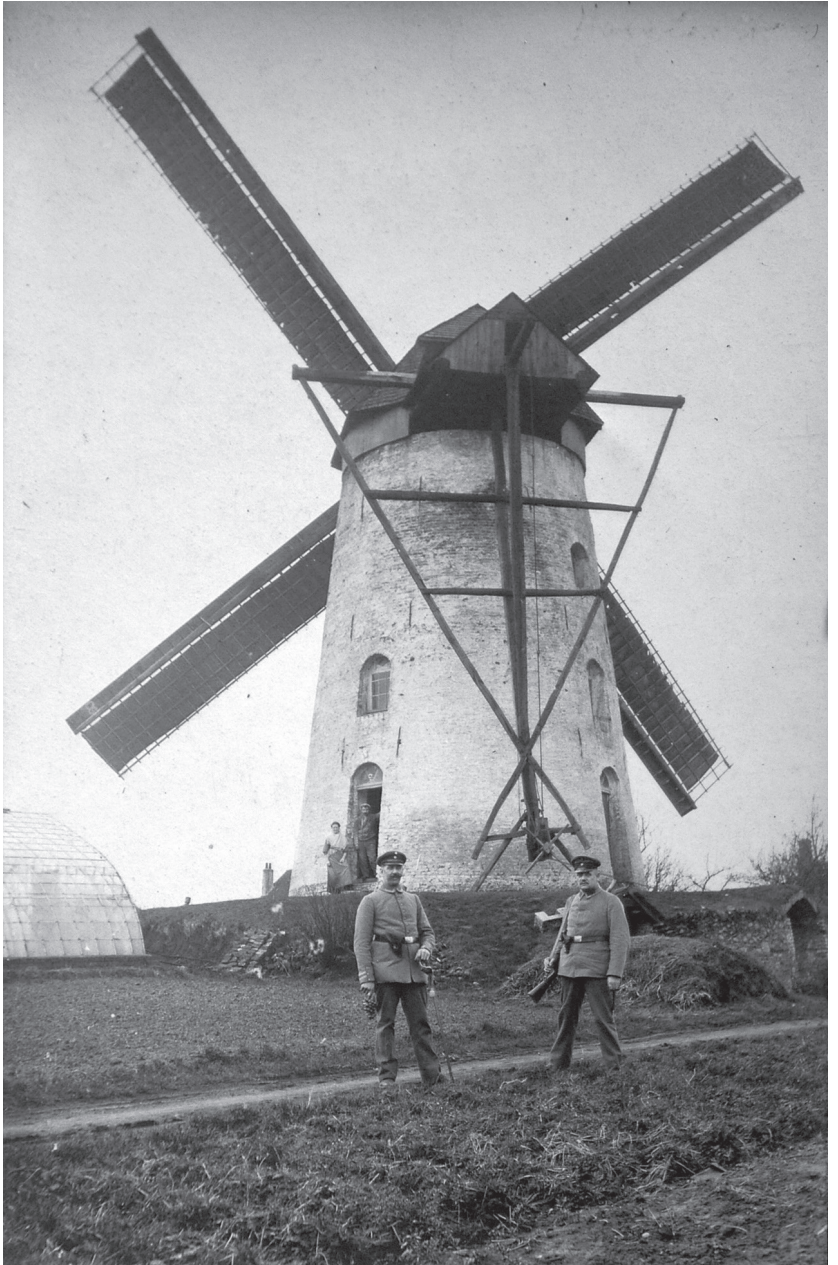
Duitse soldaten bij de molen op Terheyde