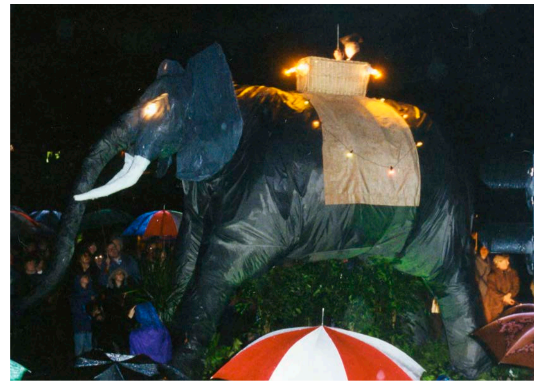
Scouts en Gidsen