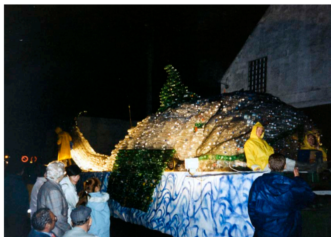
Scouts en Gidsen