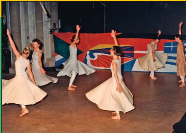
Dansballetgroep Eksit bracht een hoogstaande dansperformance en symboliseerde de machteloosheid van Hoeilaart t.o.v. de economische realiteit van de Europese Gemeenschap en de wereldhandel.