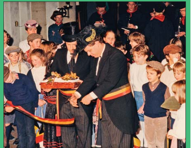
De massascène met de kinderen van beide scholen en beide harmonieën. Het was sinds 1894 geleden, bij de inhuldiging van de tramlijn Groenendaal – Overijse, dat beide muziekgroepen samen hadden gemusiceerd. Op de partituur stond het Hoeilaarts Feestlied.