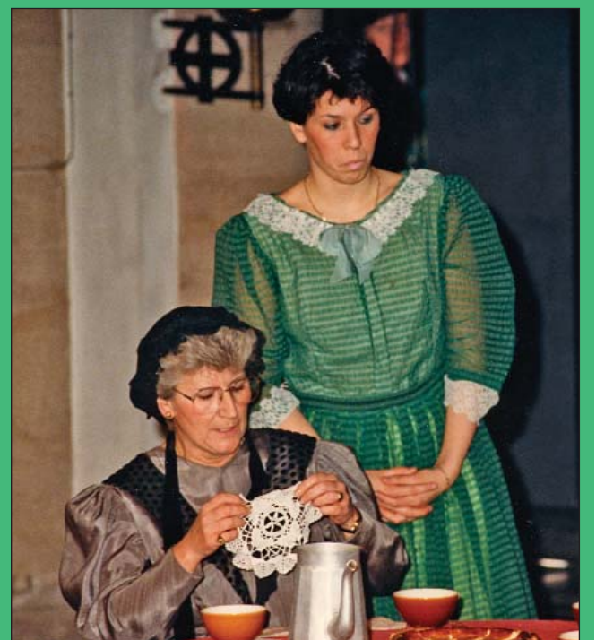
Moeder Sohie en het kinderrijke gezin kwamen tot leven in een plezierige en humorvolle scène. Klem kon hiervoor rekenen op de medewerking van Kunst na Arbeid uit Overijse.

J.V.A.: Als je het zuiver technisch bekijkt, is er al een vervolg geweest. Het totaalspektakel: "de 7 Sleutels" van de Sint-Clemensschool in 2004 volgde hetzelfde stramien maar was technisch veel beter afgewerkt. Met licht en geluid kan vandaag nu eenmaal meer dan toen. Maar een echt vervolg op 800 jaar Hoeilaart was het niet. Dat was ook de bedoeling niet. Het zou trouwens onmogelijk zijn. Het verrassingseffect, de oude liedjes, de actieve medewerking van Radio Zoniën... Het was een andere tijd. Wat niet wil zeggen dat er geen nieuw groot spektakel kan komen. Waarom niet? Het zou Hoeilaart in ieder geval deugd doen.