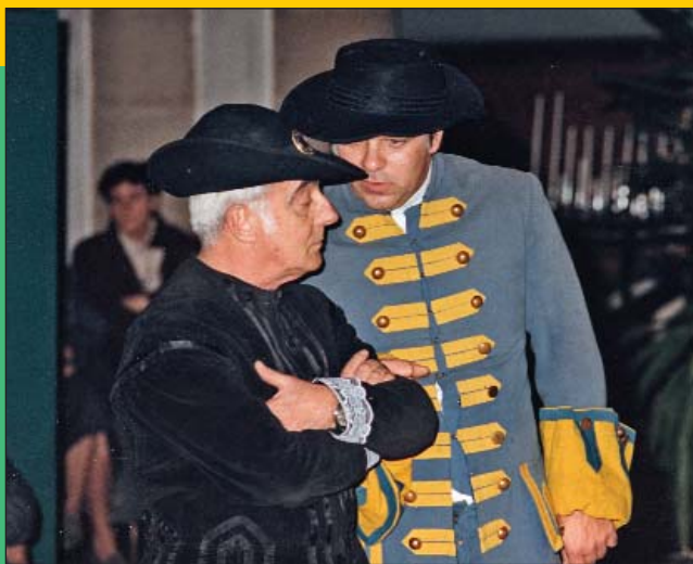
Een sergeant van het leger van Pasture belooft hulp om de cijzen rond te halen: "Mon cher, dees twee soldaten, ne parlent que leur langue maternelle. Donc, pas de flamand! Wees gerust, dat leert ge wel."