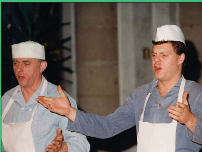
"De beenhouwers zijn hier van uit den ouden tijd". Het tweede deel opende met de Hoeilaartse beroepen van voor de druiventeelt.

J.V.A.: Deel twee werd een nog grotere verrassing. Het