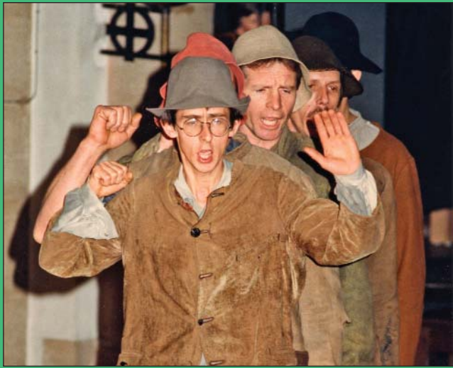
De kolenbranders van Hoeilaart. Alle liedjes van de oude beroepen werden gebracht door de Jonge Druivelaar en dateerden uit de jaren '30.