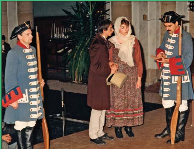
Tijdens de Franse tijd (1794) weigerde pastoor Vloeberg een koppel te trouwen omdat ze aanverwanten waren. De Jonge Druivelaar verdedigde de idealen van de Franse revolutie.