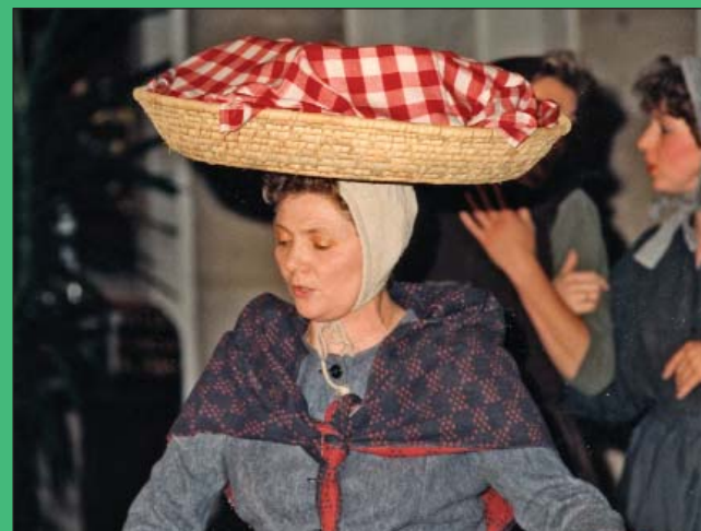
In de 19de eeuw werkten de Hoeilaartse vrouwen vooral op de markt te Brussel. "Wij moeten hele dagen, ons volle korven dragen en sleuren naar de grote stad", weerklonk het in hun lied.